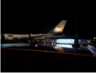
Policyjne zabezpieczenie wizyty prezydenta USA w Warszawie