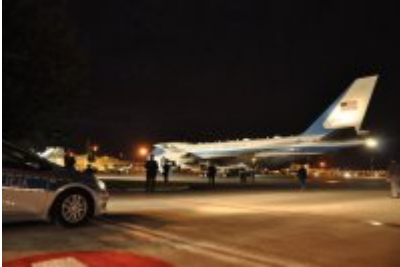
Policyjne zabezpieczenie wizyty prezydenta USA w Warszawie