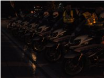
Policyjne zabezpieczenie wizyty prezydenta USA w Warszawie