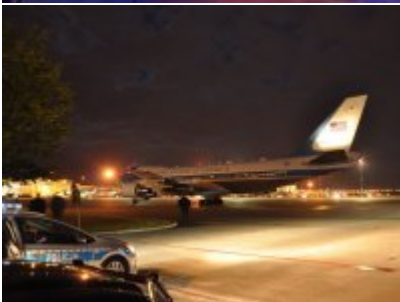
Policyjne zabezpieczenie wizyty prezydenta USA w Warszawie