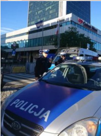
Policyjne zabezpieczenie wizyty prezydenta USA w Warszawie