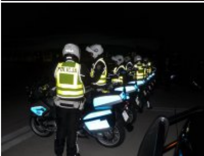
Policyjne zabezpieczenie wizyty prezydenta USA w Warszawie