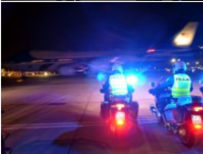
Policyjne zabezpieczenie wizyty prezydenta USA w Warszawie