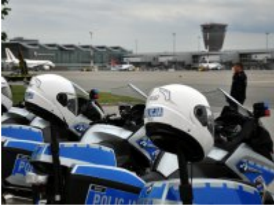
Policyjne zabezpieczenie wizyty prezydenta USA w Warszawie