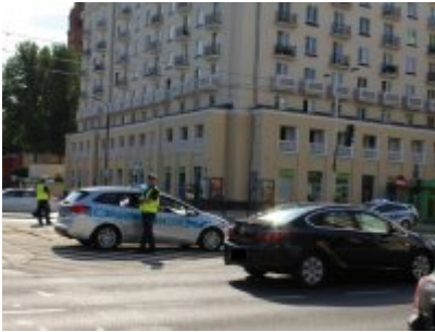
Działania policjantów WRD KSP