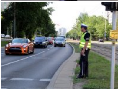
Działania policjantów WRD KSP