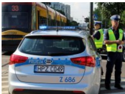
Działania policjantów WRD KSP