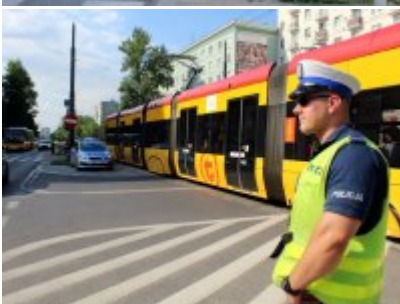
Działania policjantów WRD KSP