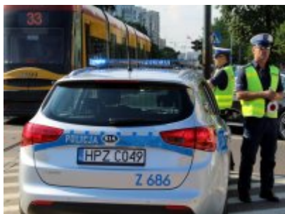
Działania policjantów WRD KSP