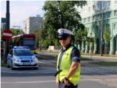
Działania policjantów WRD KSP