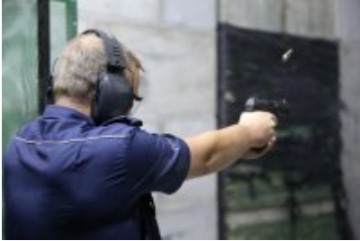
Trzeci dzień zmagañ w konkursie „Policjant Ruchu Drogowego”