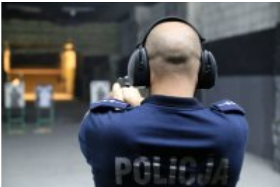
Trzeci dzień zmagañ w konkursie „Policjant Ruchu Drogowego”