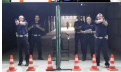
Trzeci dzień zmagania w konkursie „Policjant Ruchu Drogowego”