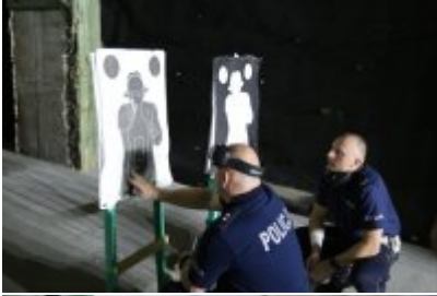
Trzeci dzień zmagañ w konkursie „Policjant Ruchu Drogowego”