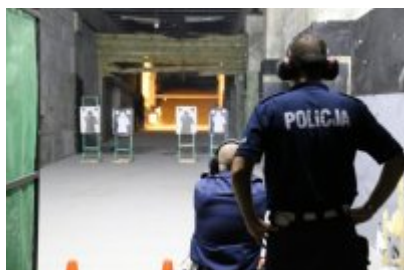
Trzeci dzień zmagania w konkursie „Policjant Ruchu Drogowego”