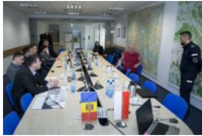
Policjanci z Mołdawii w stołecznej Policji