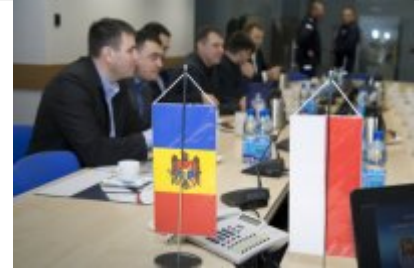
Policjanci z Mołdawii w stołecznej Policji