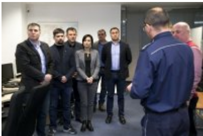
Policjanci z Mołdawii w stołecznej Policji