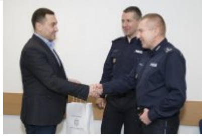
Policjanci z Mołdawii w stołecznej Policji