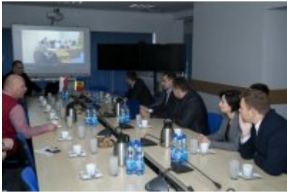
Policjanci z Mołdawii w stołecznej Policji