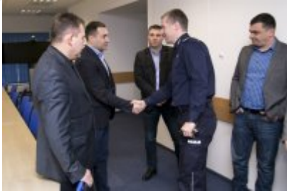
Policjanci z Mołdawii w stołecznej Policji