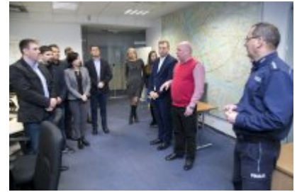
Policjanci z Mołdawii w stołecznej Policji