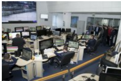
Policjanci z Mołdawii w stołecznej Policji