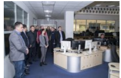
Policjanci z Mołdawii w stołecznej Policji