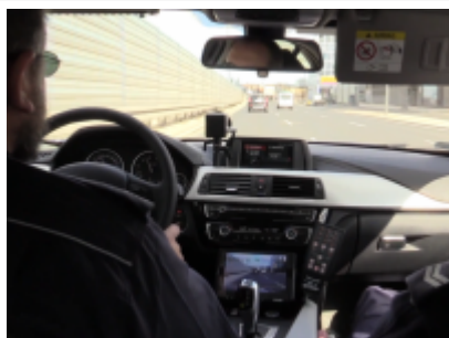
Grupa „SPEED” hamulcem na prędkość