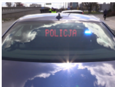
Grupa „SPEED” hamulcem na prędkość