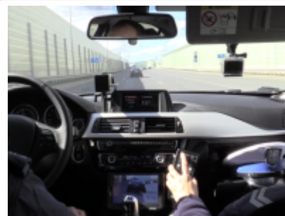
Grupa „SPEED” hamulcem na prędkość