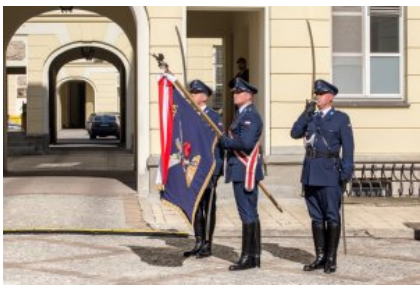
Uroczyste wręczenie odznaczeń