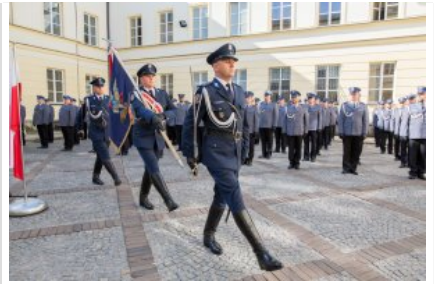
Uroczyste wręczenie odznaczeń