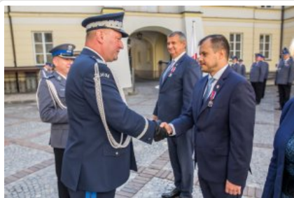
Uroczyste wręczenie odznaczeń