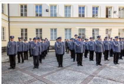
Uroczyste wręczenie odznaczeń