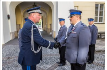
Uroczyste wręczenie odznaczeń