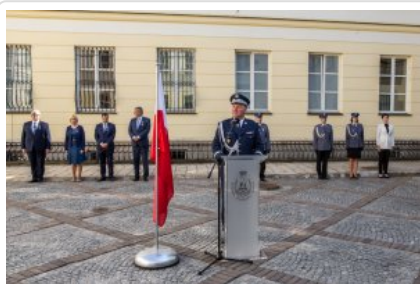
Uroczyste wręczenie odznaczeń