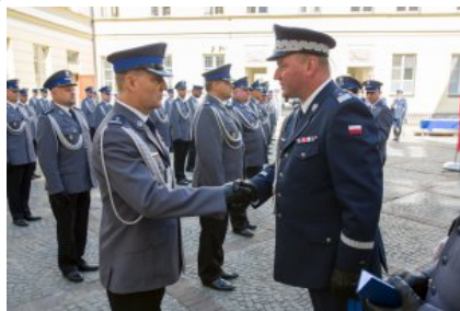
Uroczyste wręczenie odznaczeń