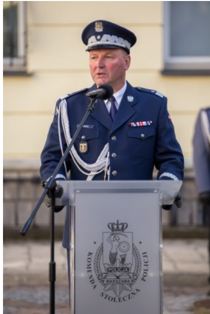
Uroczyste wręczenie odznaczeń