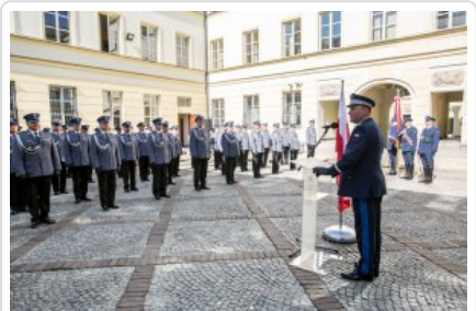
Uroczyste wręczenie odznaczeń