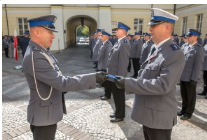
Uroczyste wręczenie odznaczeń