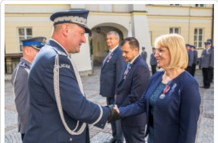
Uroczyste wręczenie odznaczeń