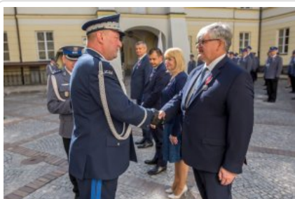
Uroczyste wręczenie odznaczeń