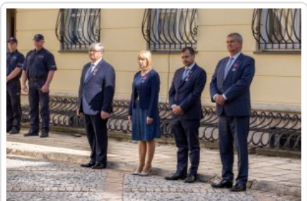
Uroczyste wręczenie odznaczeń