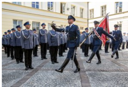
Uroczyste wręczenie odznaczeń