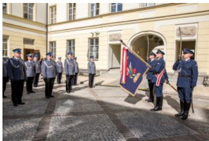
Uroczyste wręczenie odznaczeń