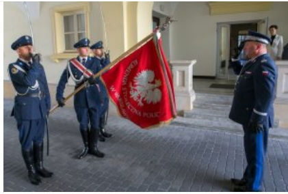
Uroczyste wręczenie odznaczeń