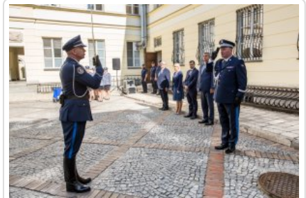
Uroczyste wręczenie odznaczeń