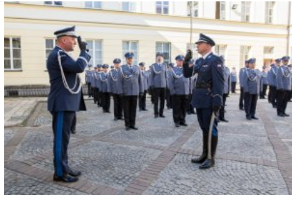
Uroczyste wręczenie odznaczeń